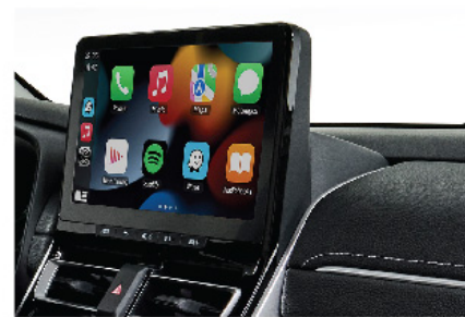
Pantalla táctil de 10.1" de fábrica con Apple Carplay Wireless, Android Carplay Cable