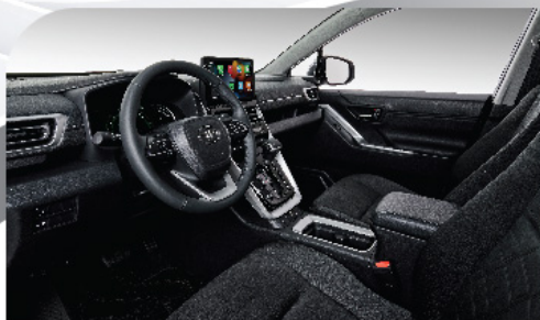
Interior más moderno, fresco y elegante