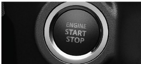
Encendido por botón