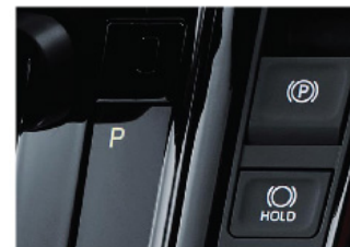
Freno de mano eléctrico con Hold