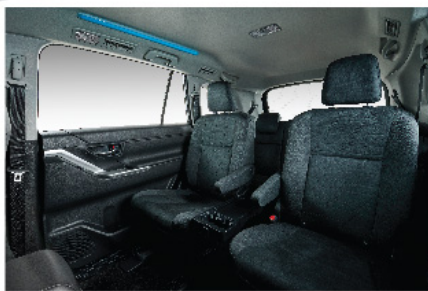
Luces interiores de ambiente Led, con opción de cambio de color.