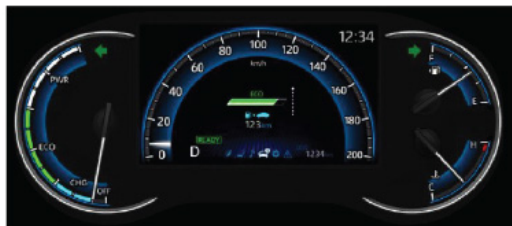
Pantalla multiinformación de 7"